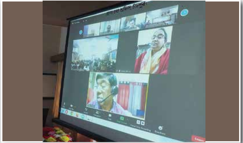
চাঁদপুর জেলা কর্মশালা-২০২১