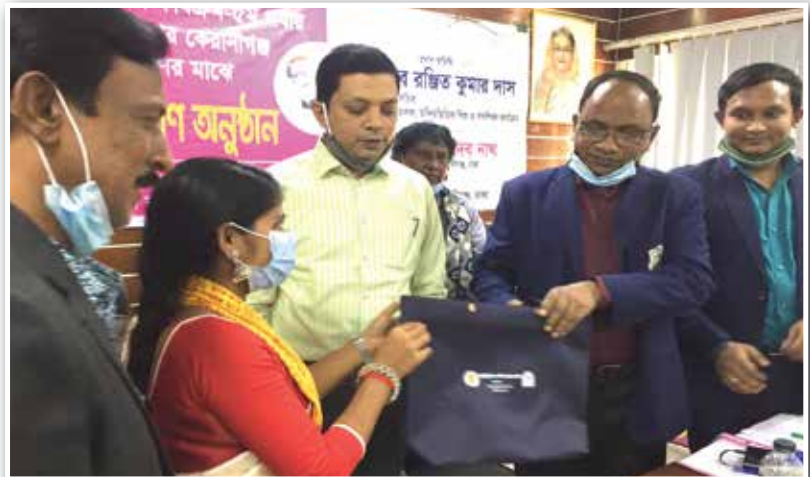
ঢাকা জেলার কেরানীগঞ্জ উপজেলা প্রশাসন কর্তৃক প্রকল্পের শিক্ষকদের মাঝে শিক্ষা সহায়ক উপকরণ প্রদান