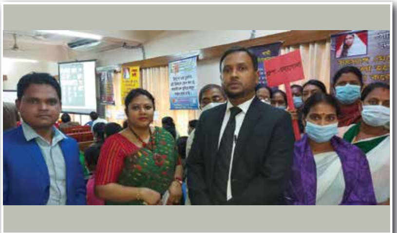
চাঁদপুর জেলা কর্মশালা