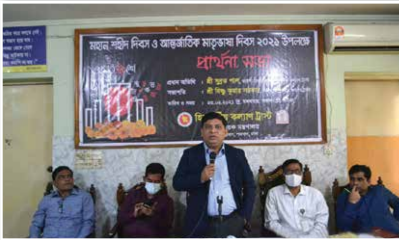
মহান শহীদ দিবস-২০২১ উপলক্ষে হিন্দুধর্মীয় কল্যাণ ট্রাস্ট কর্তৃক প্রার্থনা সভা