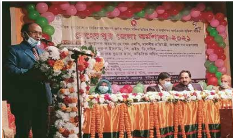
মেহেরপুর জেলা কর্মশালা-২০২১